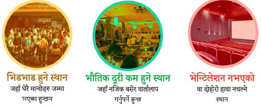
भिडभाड हुने स्थान जहाँ धेरै मान्छेहरु जम्मा भएका हुन्छन